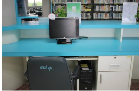
พื้นที่ดำเนินกิจกรรมบริเวณโต๊ะทำงานและเคาน์เตอร์