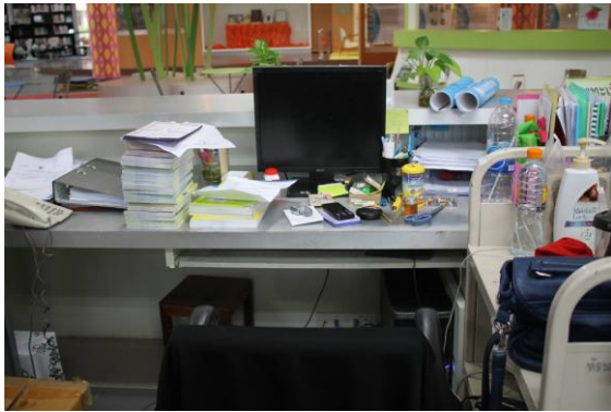
ก่อนทำกิจกรรม