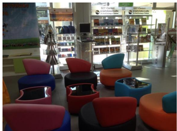
พื้นที่ดำเนินกิจกรรมบริเวณมุม SET Corner