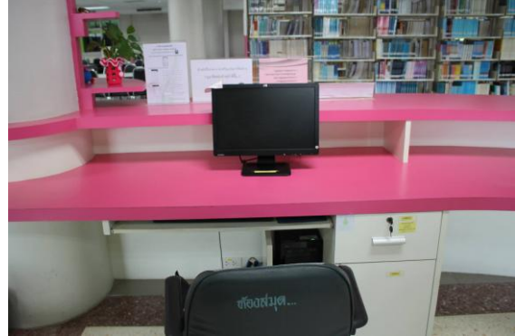
พื้นที่ดำเนินกิจกรรมบริเวณโต๊ะทำงานและเคาน์เตอร์บริการ