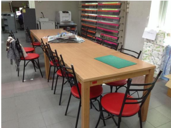
ก่อนทำกิจกรรม