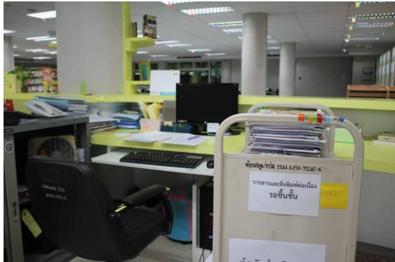
ก่อนทำกิจกรรม