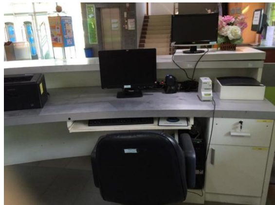
พื้นที่ดำเนินการกิจกรรมบริเวณโต๊ะทำงานและเคาน์เตอร์บริการ