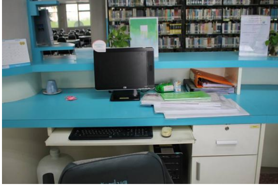
ก่อนทำกิจกรรม