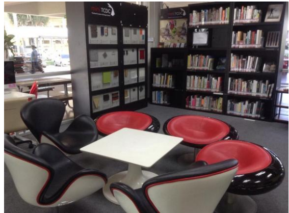
พื้นที่ดำเนินกิจกรรมบริเวณ miniTCDC