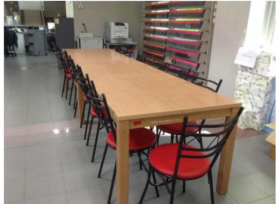
พื้นที่ดำเนินกิจกรรมบริเวณโต๊ะประชุม