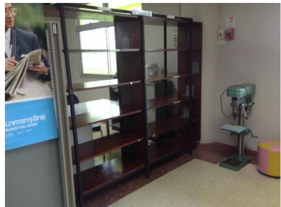
พื้นที่ดำเนินกิจกรรมบริเวณชั้นพับหนังสือ