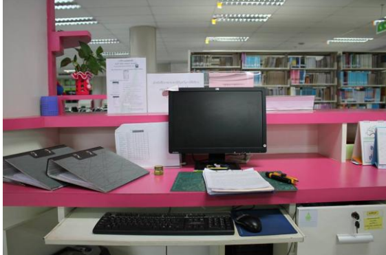
ก่อนทำกิจกรรม