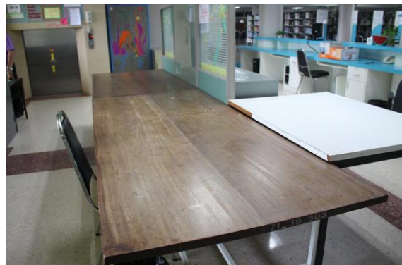
พื้นที่ดำเนินกิจกรรมบริเวณโต๊ะชมทรัพยากรสารสนเทศ