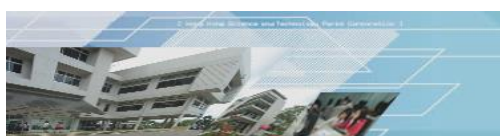
ภาพที่ 1 แบบประเมินคุณภาพการให้บริการบริการห้องสมุดมนุษย Human Library