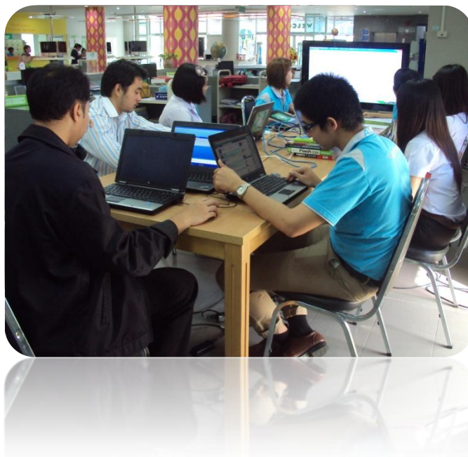
ภาพที่ 7 การอบรมโมดูลวารสารและสิ่งพิมพ์ต่อเนื่อง (Serials)