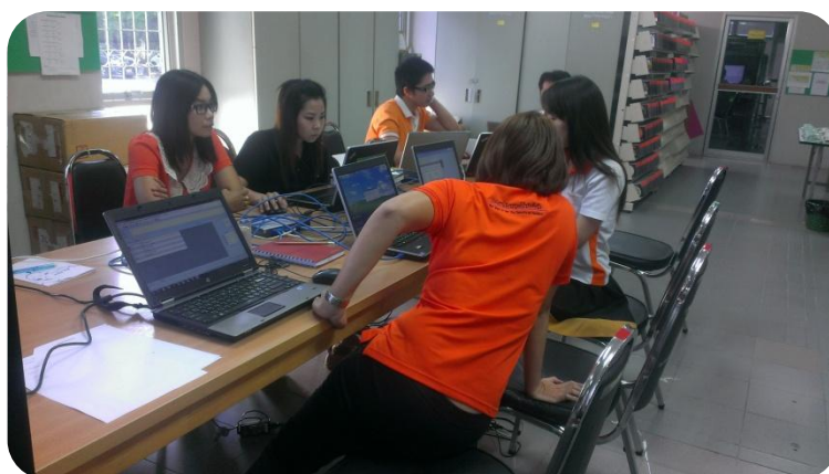
ภาพที่ 4 การอบรมโมดูลการจัดซื้อ (Acquisition)