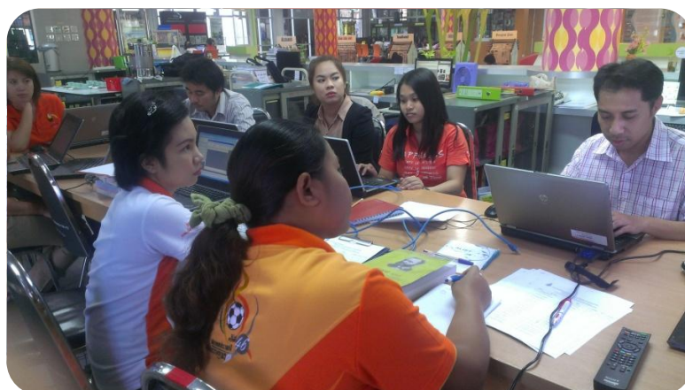
ภาพที่ 5 การอบรมโมดูลการลงรายการทรัพยากรสารสนเทศ (Cataloging)