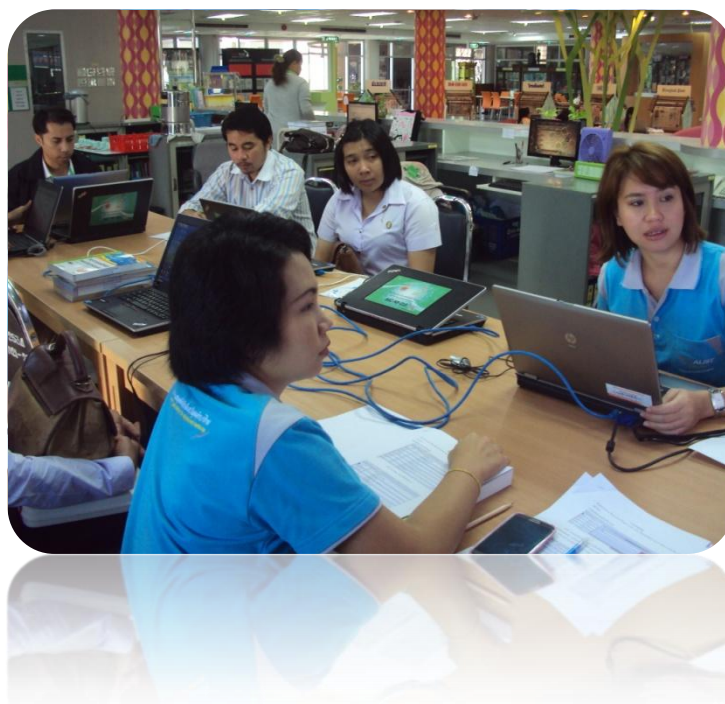
ภาพที่ 8 การอบรมโมดูลวารสารและสิ่งพิมพ์ต่อเนื่อง (Serials)