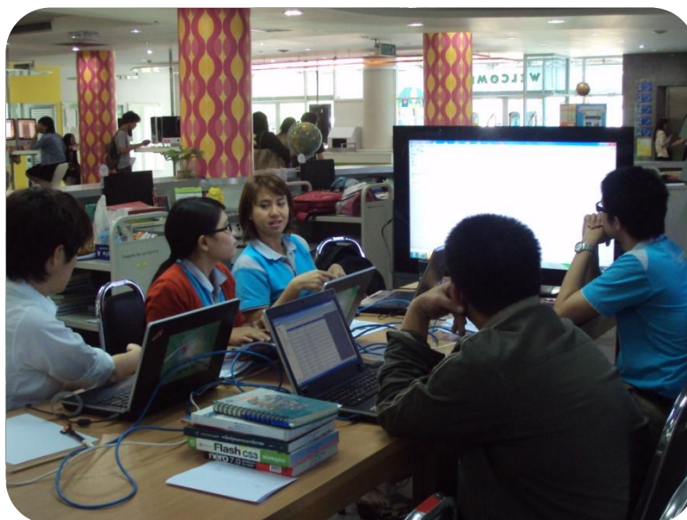
ภาพที่ 10 การอบรมโมดูลผู้ดูแลระบบ (System admin)