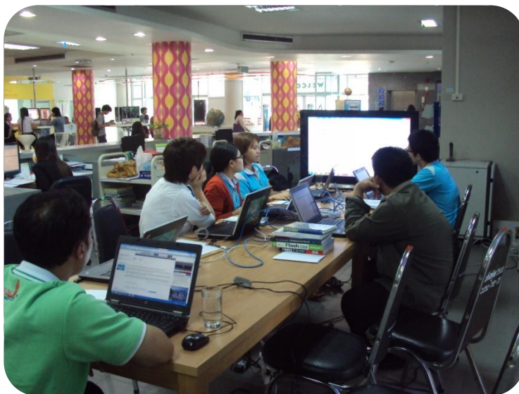
ภาพที่ 9 การอบรมโมดูลผู้ดูแลระบบ (System admin)