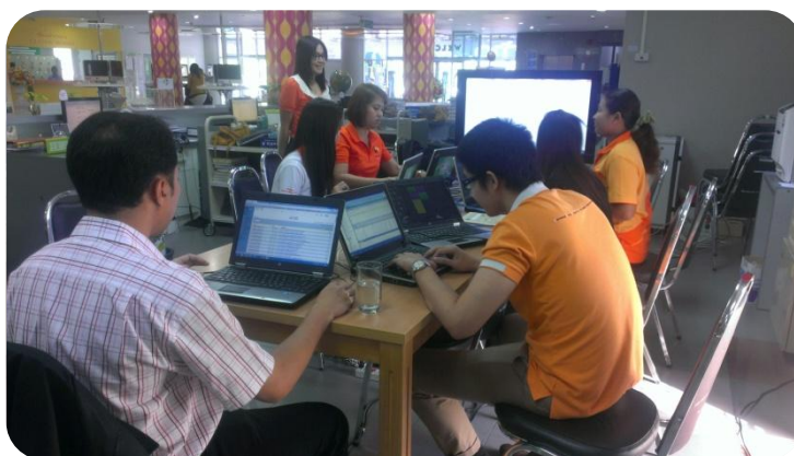
ภาพที่ 3 การอบรมโมดูลการจัดซื้อ (Acquisition)