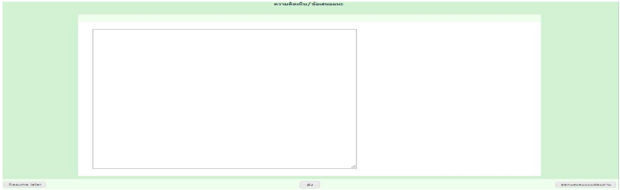
ภาพที่ 1 แบบประเมินผลการสำรวจความพึงพอใจของบุคลากรฝ่ายวิทยบริการ สำนักวิทยบริการและเทคโนโลยีสารสนเทศ ประจำปีการศึกษา 2556

6.2 ผลการวิเคราะห์การสำรวจความพึงพอใจของบุคลากรฝ่ายวิทยบริการ สำนักวิทยบริการและเทคโนโลยีสารสนเทศประจำปีการศึกษา 2556 โดยได้จากแบบประเมินผลการสำรวจความพึงพอใจของบุคลากรฝ่ายวิทยบริการ สำนักวิทยบริการและเทคโนโลยีสารสนเทศประจำปีการศึกษา 2556 ที่มีลักษณะคำถาม 2 แบบ ได้แก่