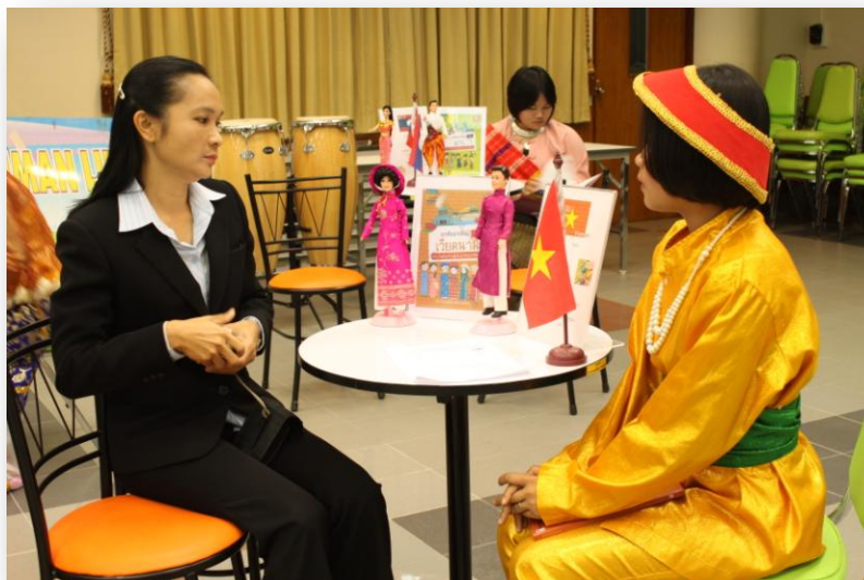
ภาพที่ 13 การสาธิตการยืม-คืนหนังสือ ในรูปแบบห้องสมุดมนุษย์ (Human Library)