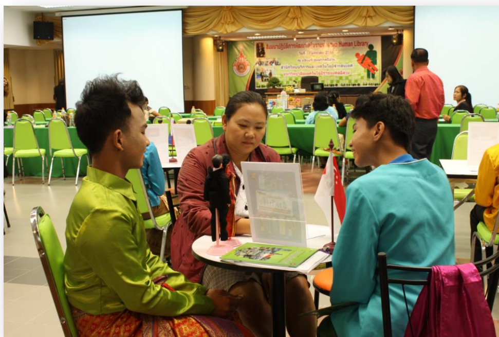
ภาพที่ 12 การสาธิตการยืม-คืนหนังสือ ในรูปแบบห้องสมุดมนุษย์ (Human Library)