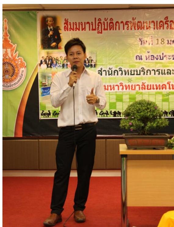
ภาพที่ 6 ปฏิบัติการพัฒนาห้องสมุดมนุษย์ (Human Library)

ซึ่งท่านได้เป็นหนังสือมีชีวิต เรื่อง “เรือนโคราช”