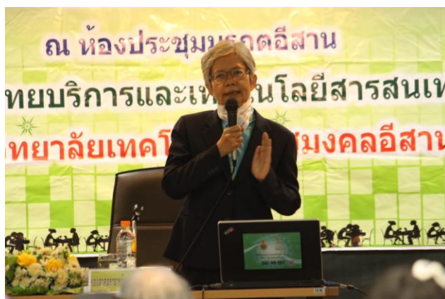
ภาพที่ 5 ปฏิบัติการพัฒนาห้องสมุดมนุษย์ (Human Library)