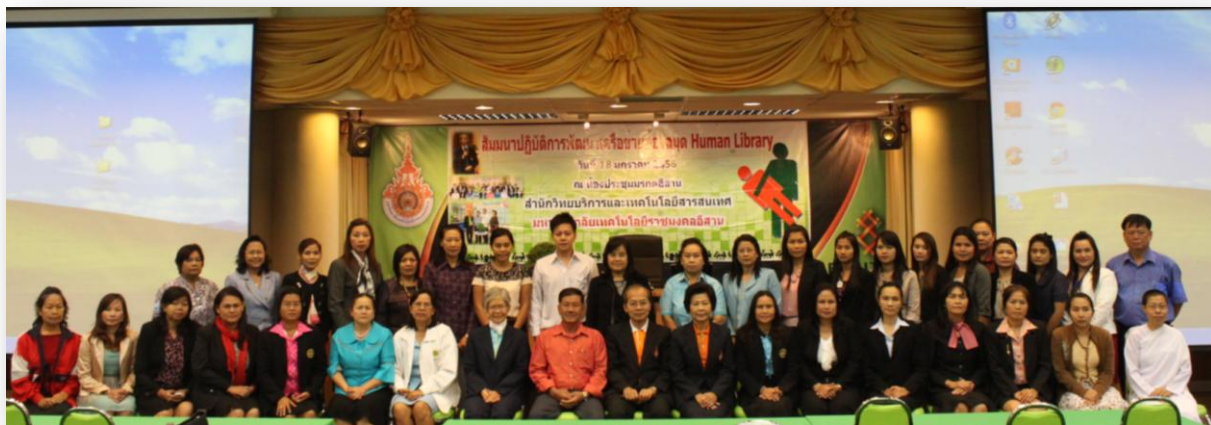
ภาพที่ 11 ผู้เข้าร่วมสัมมนาปฏิบัติการพัฒนาห้องสมุดมนุษย์ (Human Library) และเครือข่ายห้องสมุดมนุษย์แห่งประเทศไทย (Thailand Human Library Network)