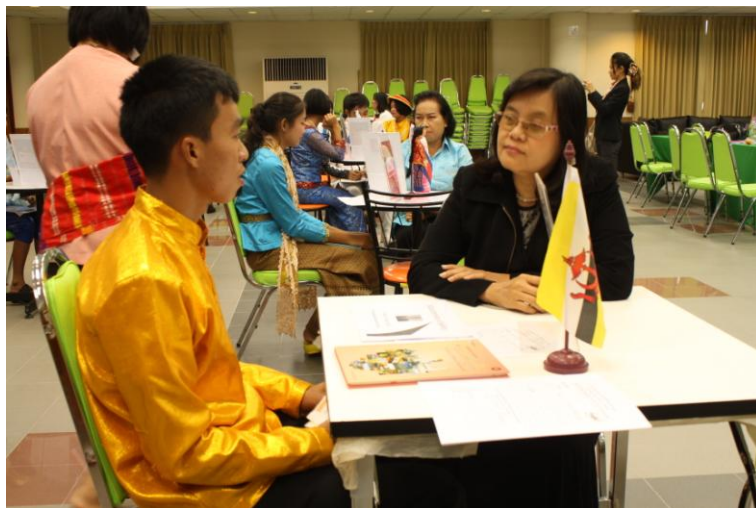
ภาพที่ 15 การสาธิตการยืม-คืนหนังสือ ในรูปแบบห้องสมุดมนุษย์ (Human Library)