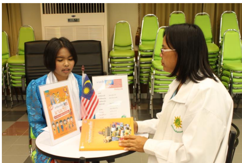
ภาพที่ 14 การสาธิตการยืม-คืนหนังสือ ในรูปแบบห้องสมุดมนุษย์ (Human Library)