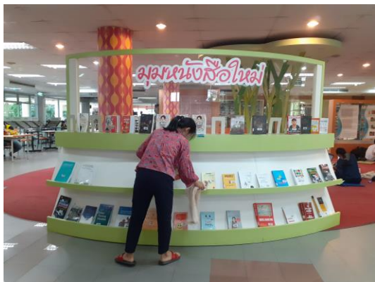
ก่อนทำกิจกรรม