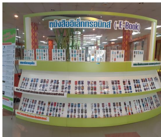
พื้นที่บริเวณมุมหนังสืออิเล็กทรอนิกส์ (E-Book)