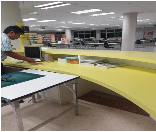
ก่อนทำกิจกรรม