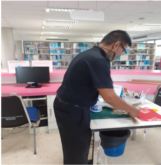
ก่อนทำกิจกรรม