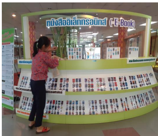
ก่อนทำกิจกรรม