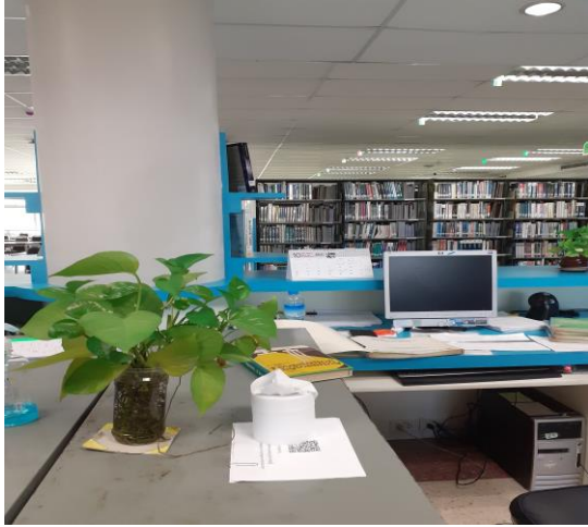
ก่อนทำกิจกรรม