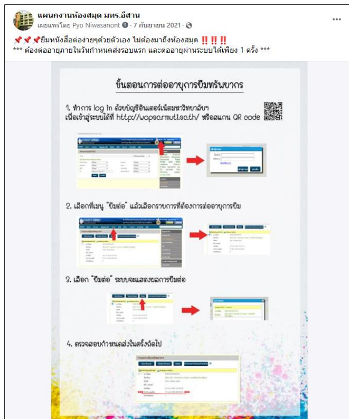
ภาพที่ 2 การยืมต่อหนังสือออนไลน์